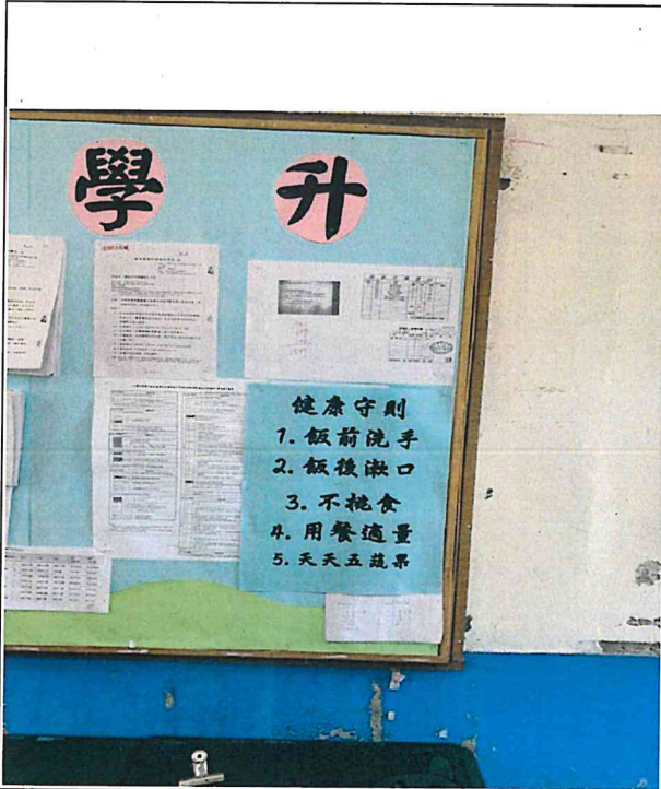
說明：班級公佈欄製作健康守則