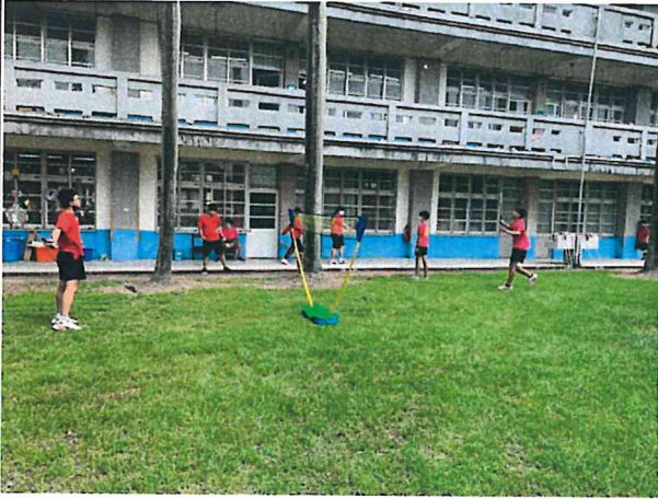
說明：學生下課教室前打羽球