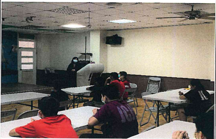
說明：學生參予討論