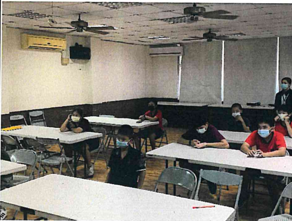
說明：班會課時討論健康守則