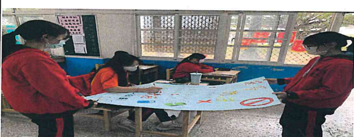
說明：師生互動良好