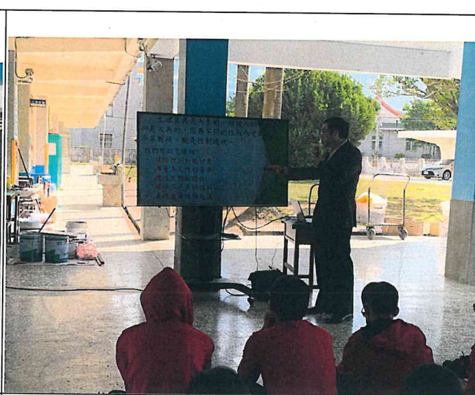
說明：校園霸凌宣導