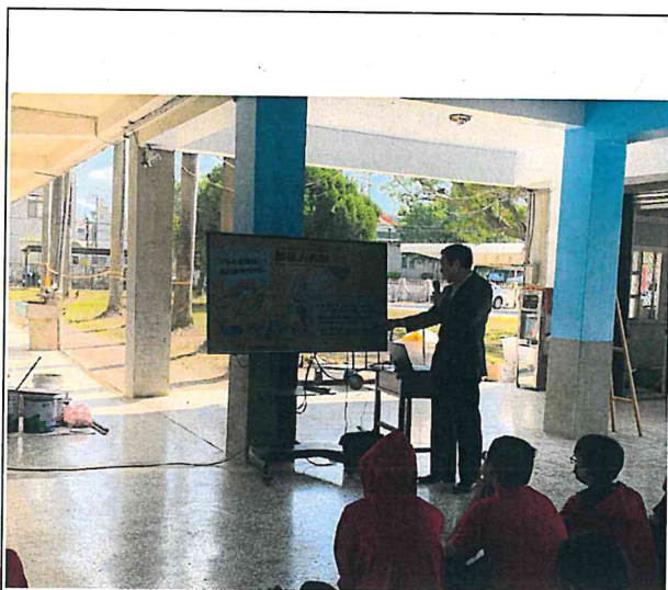
說明：開學友善校園宣導