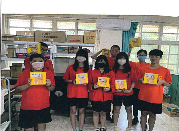
說明：收到愛心人士贈送學生物資