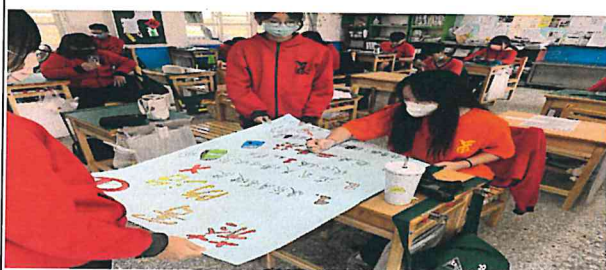
說明：學生親手製作班級壁報