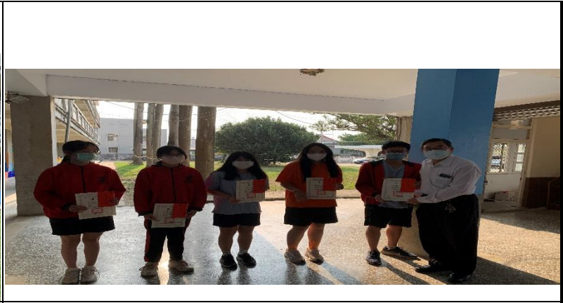
內容：朝會頒發獎狀和獎金鼓勵學生